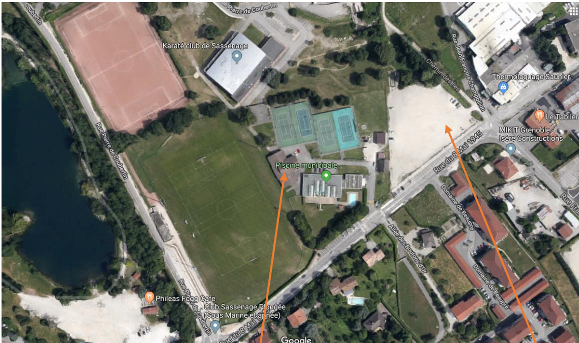
Maison des Clubs